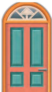
H206 a Alter Physikraum b Kunstraum c Videoraum