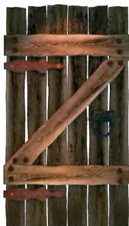
H 208 a Streitschlichterraum b PC Raum c Lernwerkstatt