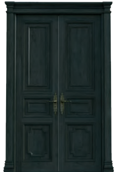
H308 a Lernwerkstatt b PC Raum c Kunstraum

https://pixabay.com/de/vectors/19c3%bcr-eingang-haust%cc3%bcr-eintrag-575966/ 10.12.2021, 14 Uhr https://pixabay.com/de/vectors/19c3%bcr-eingang-haust%cc3%bcr-eintrag-575970/ 10.12.2021, 14 Uhr https://pixabay.com/de/illustrations/19c3%bcr-haust%cc3%bcr-eintrag-3986684/ 10.12.2021, 14 Uhr https://pixabay.com/de/illustrations/19c3%bcr-holztor-19c3%bcr-holztor-rost-2361812/ 10.12.2021, 14 Uhr