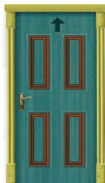
H307 a Kunstraum b Alter Physikraum c Videoraum