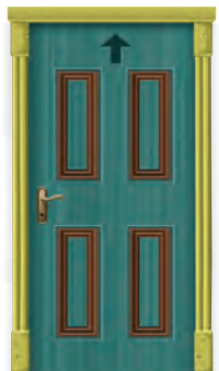
H307 a Kunstraum b Alter Physikraum c Videoraum