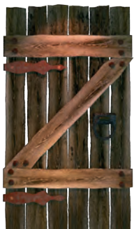
H 208 a Streitschlichterraum b PC Raum c Lernwerkstatt