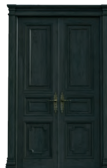
H308 a Lernwerkstatt b PC Raum c Kunstraum