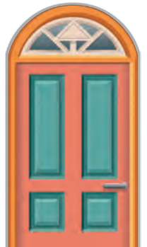
H206 a Alter Physikraum b Kunstraum c Videoraum